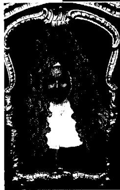
V vlogi cesarja