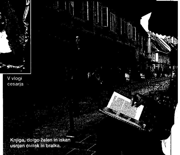
Knjiga, dolgo zelen in iskan usnjen ovitek in bralka.