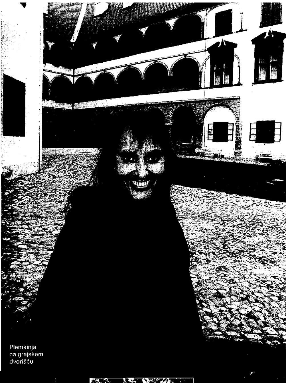
Plemkinja na grajskem dvorišču