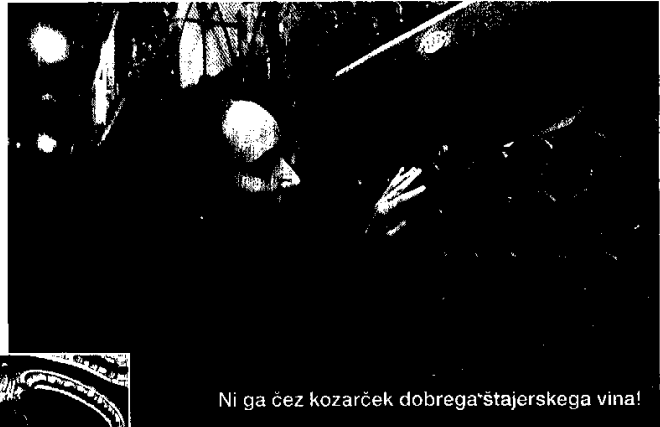
Ni ga čez kozarček dobrega štajerskega vina!