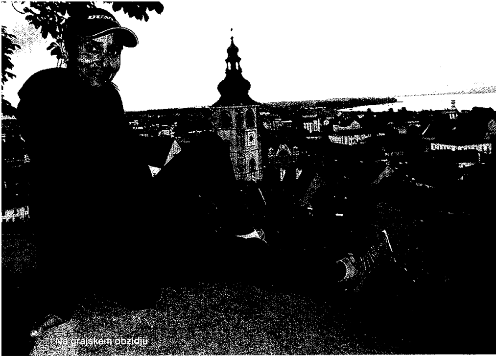
Ne, grajskem obzidju

► bila na potovanju v ZDA, je zaradi spleta srečnih okoliščin opravila padalski tečaj. In sploh je že od malega rada bila v zraku. »V vsakdanjem življenju dojemamo stvari približno v višini oči. Kar je omejeno. Zato grem rada »gor«, da se mi odpre pogled, spremeni perspektiva.« In smo leteli. Eni pogumno, drugi malo manj. Ampak diplome smo vseeno dobili.